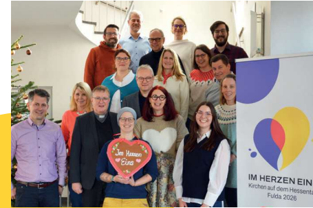
Die ökumenische Projektgruppe bei einem ihrer Vorbereitungstreffen.

Zum Hesstentag 2026 (12.–21. Juni) gestalten die Kirchen in Fulda unter dem Motto „ Im Herzen eins “ ein gemeinsames ökumenisches Programm. Begegnung, Glauben und Gemeinschaft stehen im Mittelpunkt – getragen von Verbundenheit über Konfessions-, Herkunfts- und Lebensgrenzen hinweg.